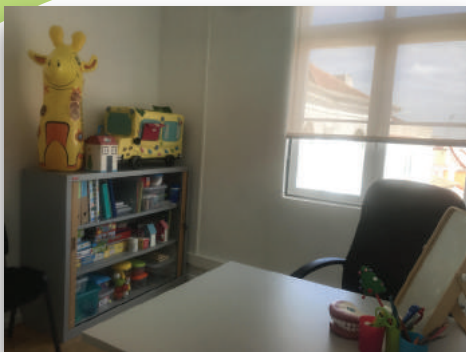
Sala de Terapia da Fala