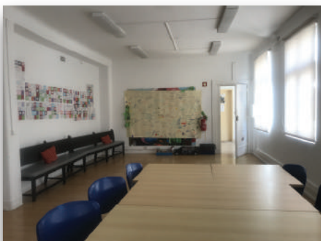
Sala de Reuniões